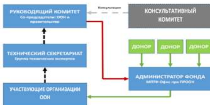
Рисунок 2. Структура управления МПТФЧБ

Офис Много-партнерского Трастового Фонда при ПРООН (Офис МПТФ) специальное подразделение ООН, занимающееся вопросами учреждения и деятельности механизмами коллективного финансирования, будет администрировать МПТФЧБ в качестве Администратора Фонда. К его основным обязанностям относятся получение взносов от доноров, управление финансами Фонда в соответствии с правилами, политикой и процедурами ООН, подготовка консолидированных описательных и финансовых отчетов на основе отчетов, предоставленных УОООН.